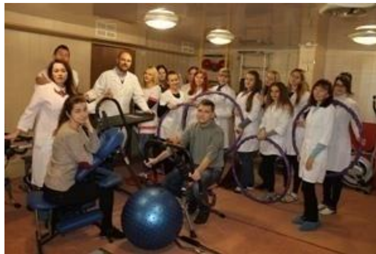
«Занятие в тренажерном зале диспансера»