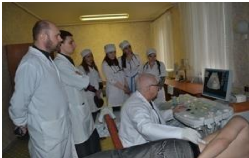
Занятие в кабинете ультразвуковой диагностики при клиническом разборе больного госпиталя