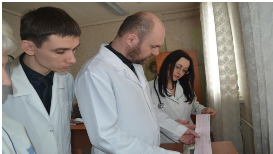
Клинический разбор больного кардиологического отделения: расшифровка ЭКГ,